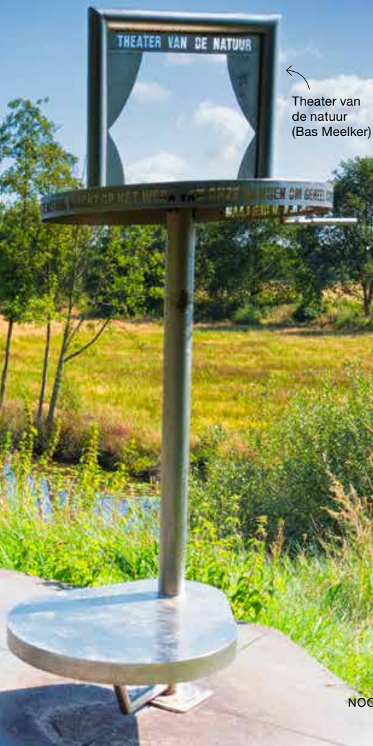
Theater van de natuur (Bas Meelker)