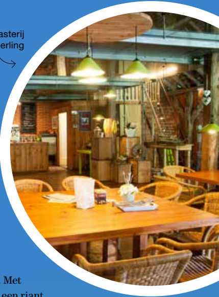
Gasterij Natuurlijk Smeerling

Niks moet, alles mag in Westerwolde. Met onderweg – daar is over nagedacht! – een riant aantal zitbankjes, picknicktafels en parkeerplaatsen voor het betere verpozen. Rond het kleine Jispinghuizen bijvoorbeeld, of Ter Wupping met z'n kruidige hooilanden, robuuste houtwallen en golvende velden. Alleen de naam van het buurtschap klinkt al bekoorlijk. Vermoeid van alle indrukken? Westerwolde grossiert in excentrieke slaapadresjes. Ga eens slapen in een wijnvat of hunebedkamer. Of boek eens een pionierswagon langs het traject van de museumspoorlijn Veendam – Stadskanaal – Musselkanaal. Dat slaapt spectaculair. Een hart vol dromen, het hoofd leeg, de ogen toe. 📍